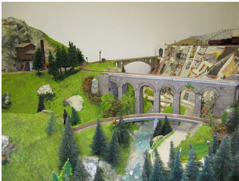
H0-Bahn-Anlage im Bau: Lötarbeiten