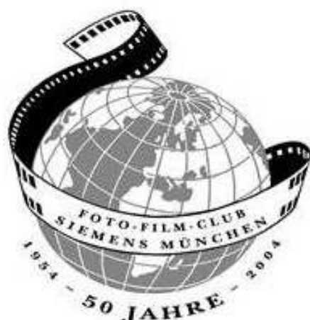
Foto-Film-Club Siemens München e.V.